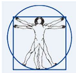
Tabela 2.2.2. Kierunkowe efekty uczenia się. Umiejętności (U)